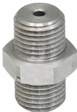
SW 90 G1/4-AG

La resistenza di flusso SW viene fornito come prodotto finito per connessione.