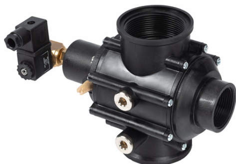
EMVP 50 24V-DC 3/2 NC