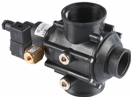
EMVP 50 230V-AC 3/2 NO

La electroválvula EMVP se suministra como producto listo para su conexión.