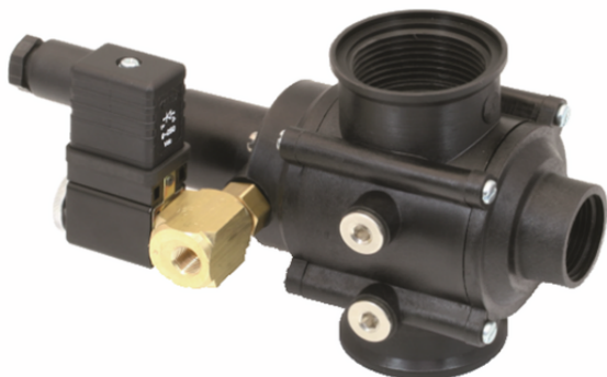
EMVP 32 230V-AC 3/2 NO