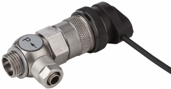
EMV 3 24V-DC 2/2 NC K-2P

La electroválvula EMV se suministra como producto listo para su conexión.