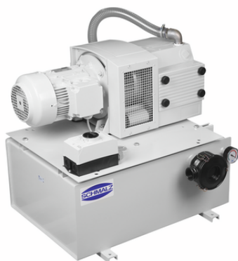
VZ-TR 80 AC3 100 MS IE3-TYP1

La centrale de vide est livrée prête à être raccordée.