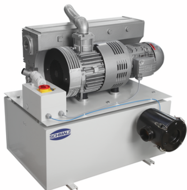
VZ-OG 165 AC3 200

La centrale de vide est livrée prête à être raccordée.