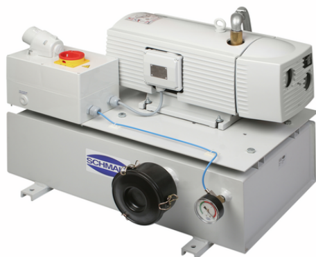
VZ-TR 25 AC3 50 GMS