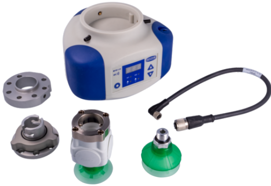
ROB-SET ECBPi FAIRINO