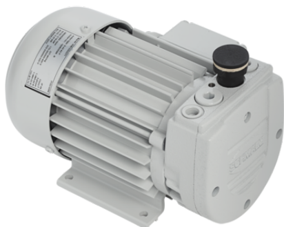
EVE-TR 8 AC3

La pompe à vide à rotor sec EVE-TR est livrée prête à être raccordée.