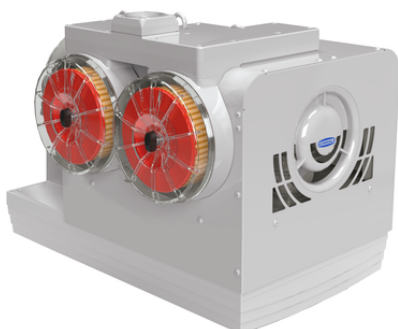
EVE-KL 300 AC3 IE3-TYP4 F

La pompa a griffe EVE-KL, disponibile in tre dimensioni per tutte le tensioni di rete comuni, viene fornita come prodotto pronto per il collegamento.