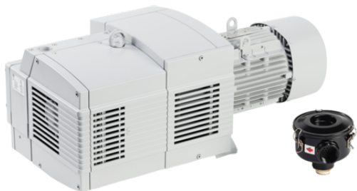
EVE-TR 80 AC3 IE3-TYP4 F

La pompe à vide à rotor sec EVE-TR est livrée prête à être raccordée.