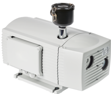
EVE-TR 25 AC3 IE3-TYP2 F