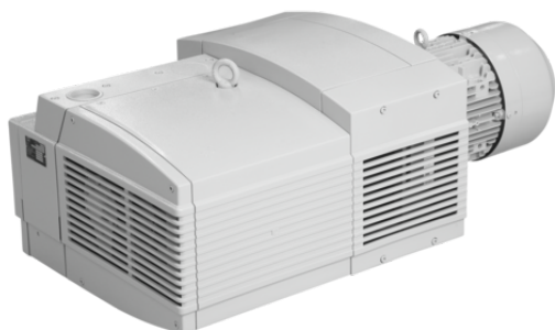
EVE-TR 100 AC3 IE3-TYP1

La pompa a vuoto a secco EVE-TR viene fornita come prodotto finito per connessione.