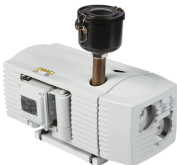
EVE-TR 10 AC F

La pompe à vide à rotor sec EVE-TR est livrée prête à être raccordée.