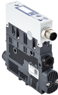
SCPSi BY 2-14 G02 NO M12-5