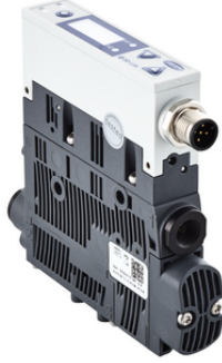
SCPSi BY 2-14 G02 NO M12-5

Kompakt ejektör SCPS / SCPSc / SCPSi bağlanmaya hazır bir ürün olarak teslim edilir (bağlantı kablosu olmadan).