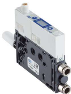
SCPMi 12 S04 NO M8-6 EAT

L'eiettore compatti SCPM viene fornito come prodotto finito per connessione (senza cavo di connessione).