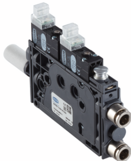
SCPMb 12 S04 NO EAN

L'eiettore compatti SCPM viene fornito come prodotto finito per connessione (senza cavo di connessione).