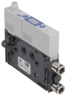
SCPMc 10 S04 NC M8-6 1PA DEY