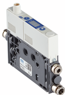
SCPMc EV S09 NC M8-6 PNP ABA

Das Minikompektventil SCPM EV wird als anschlussfertiges Produkt (ohne Anschlusskabel) geliefert.