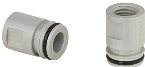
ADP-G M7-IGx15 SCPMi/c/b