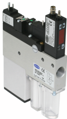
SMP 20 NC AS VD

コンパクトエジェクタ SCP/SMPは、すぐに接続可能な製品として納品されます。(電気接続ケーブルは別途お求めください)