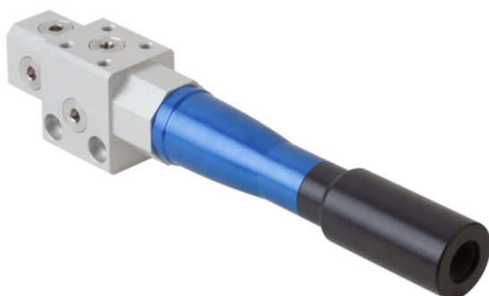
SBP HF 3 13 22 SD

L'eiettore base SBP-HV/HF vengono forniti come prodotto finito per connessione.