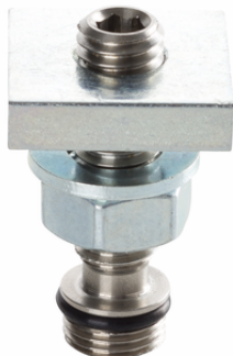
SET SFE 13