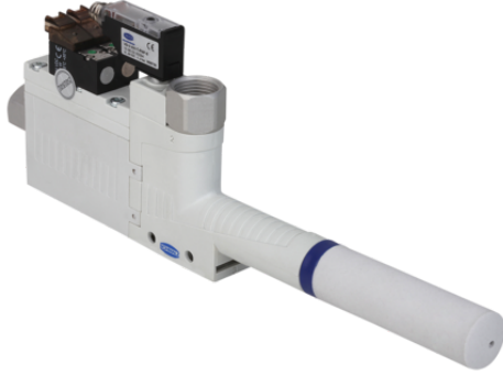
SBP-C 20 G03 NO A VS-T

Temel ejektör SBP-C bağlanmaya hazır bir ürün olarak teslim edilir (bağlantı kablosu olmadan).