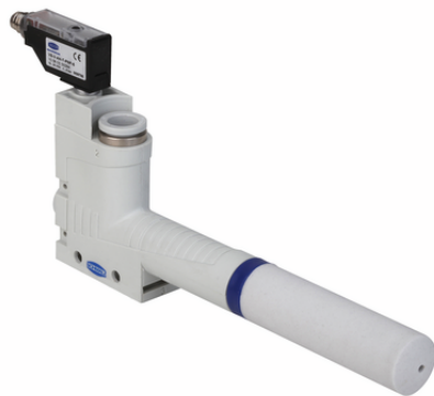
SBP-C 25 S03 VS-T

L'éjecteur basique SBP-C est livré prêt à être raccordé (sans câble de raccordement).