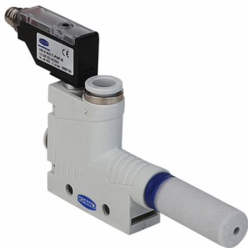
SBP-C 15 S02 VS-T

L'éjecteur basique SBP-C est livré prêt à être raccordé (sans câble de raccordement).