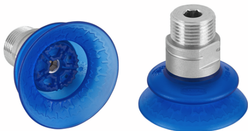
SAXB 40 ED-85 M16-AG

La ventosa a soffiETTO SAXB, disponibile in vari diametri, è fornita con un nipplo di collegamento sovrastampato ad incastro.