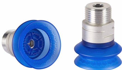
SAXB 30 ED-85 M16-AG

La ventosa de fuelle SAXB, disponible en varios diámetros, se suministra con una boquilla de conexión moldeada.