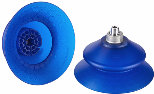
SAXB 120 ED-85 M10-AG

La ventosa de fuelle SAXB, disponible en varios diámetros, se suministra con una boquilla de conexión moldeada.