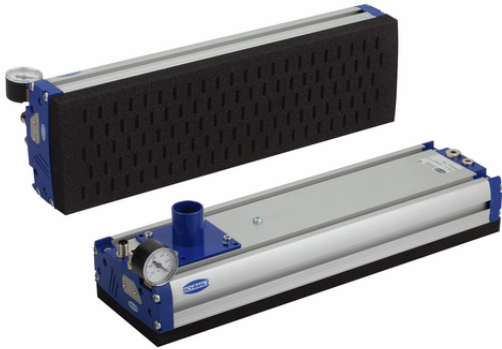
FMP-S-SW60 442 5R18 O10O10 G32