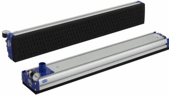
FMP-S-SVK 838 5R18 O10O10 F G60