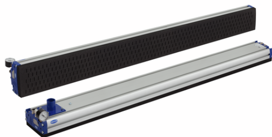
FMP-S-SVK 1432 5R18 O10O10 G60