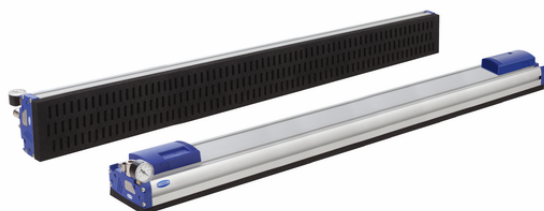
FXP-SVK 1036 3R18 O10O10 F