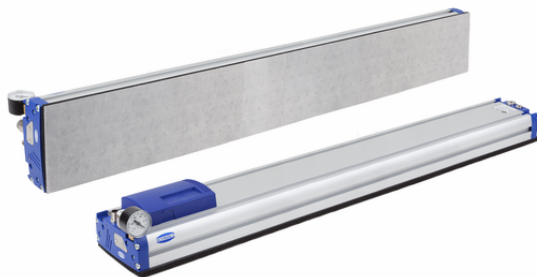
FXP-S-SVK 1432 5R18 N10SU