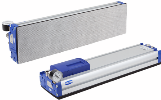
FXP-S-SVK 838 5R18 N10SU