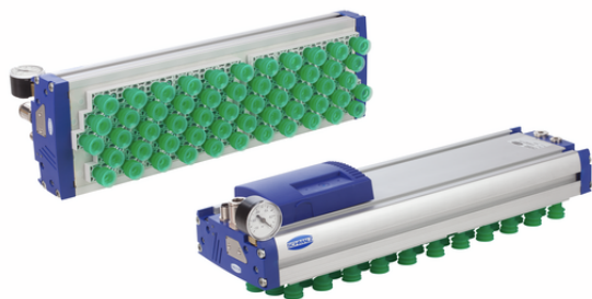
FXP-S-SVK 442 5R36 SPB2-20-P