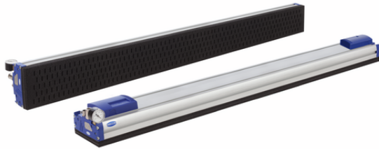
FXP-S-SVK 1432 5R18 O10010 F