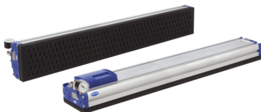
FXP-S-SVK 838 5R18 O10O10 F