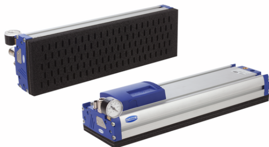
FXP-S-SVK 442 5R18 O10O10