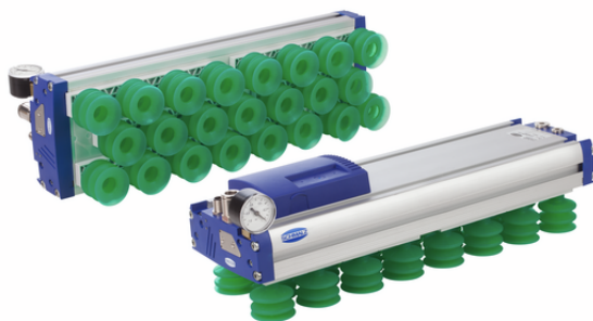
FXP-SVK 442 3R54 SPB2-40P F