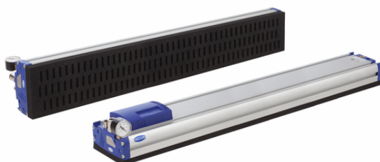
FXP-SW70 640 3R18 O20