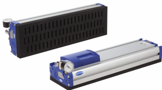
FXP-SVK 442 3R18 O20