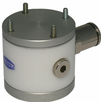
VEE-RU 55x55 20 FL