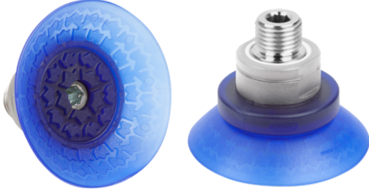
SAX 60 ED-85 G3/8-AG

Çeşitli çaplarda mevcut olan SAX vantuz, elastomer parçaya vulkanize edilmiş bağlantı nipeli ile birlikte teslim edilir.