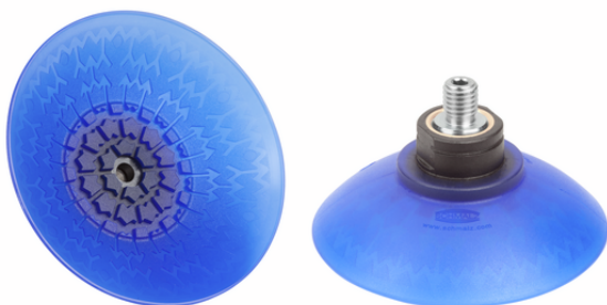
SAX 115 ED-85 G1/4-AG RP

La ventouse SAX, disponible en différents diamètres, est livrée avec insert de connexion vulcanisé à la pièce en élastomère.