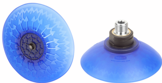
SAX 80 ED-85 G1/4-AG RP

La ventouse SAX, disponible en différents diamètres, est livrée avec insert de connexion vulcanisé à la pièce en élastomère.