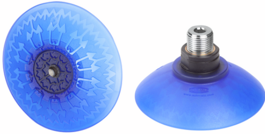
SAX 80 ED-85 G3/8-AG RP

La ventosa SAX, disponibile in diversi diametri, viene fornita con nipplo di connessione vulcanizzato alla parte in elastomero.