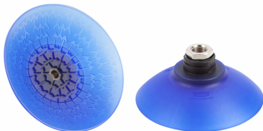
SAX 115 ED-85 G1/4-IG RP

ベル型真空パッド SAX: 様々なサイズをラインアップ、接続ニップルがパッドに取り付けられた状態で納品されます。